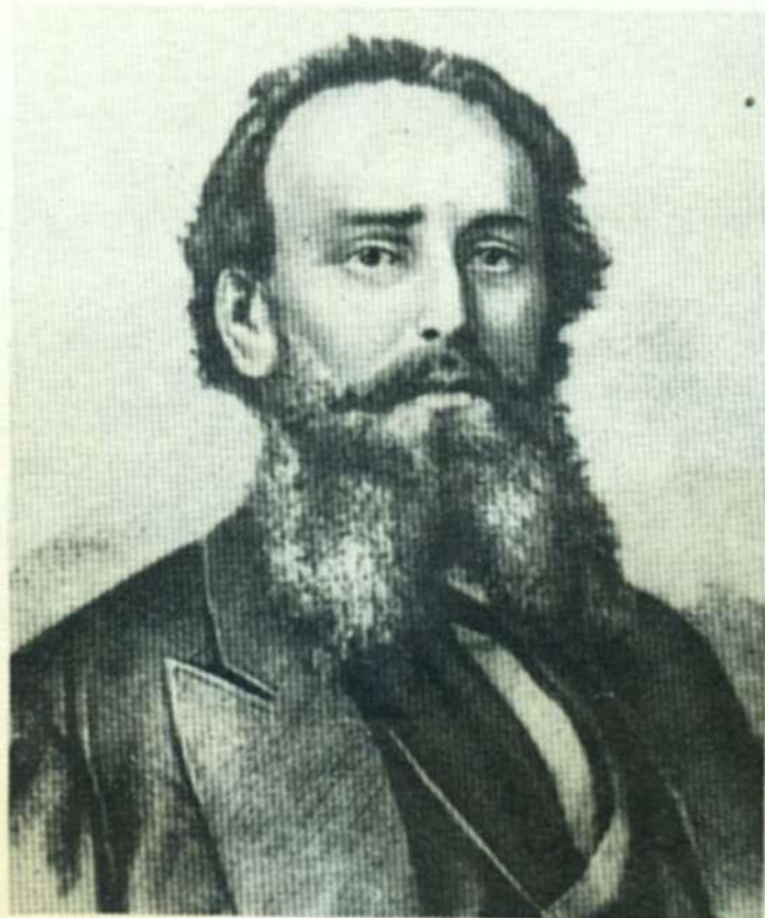
А. М. Опекушин 1841 - 1923