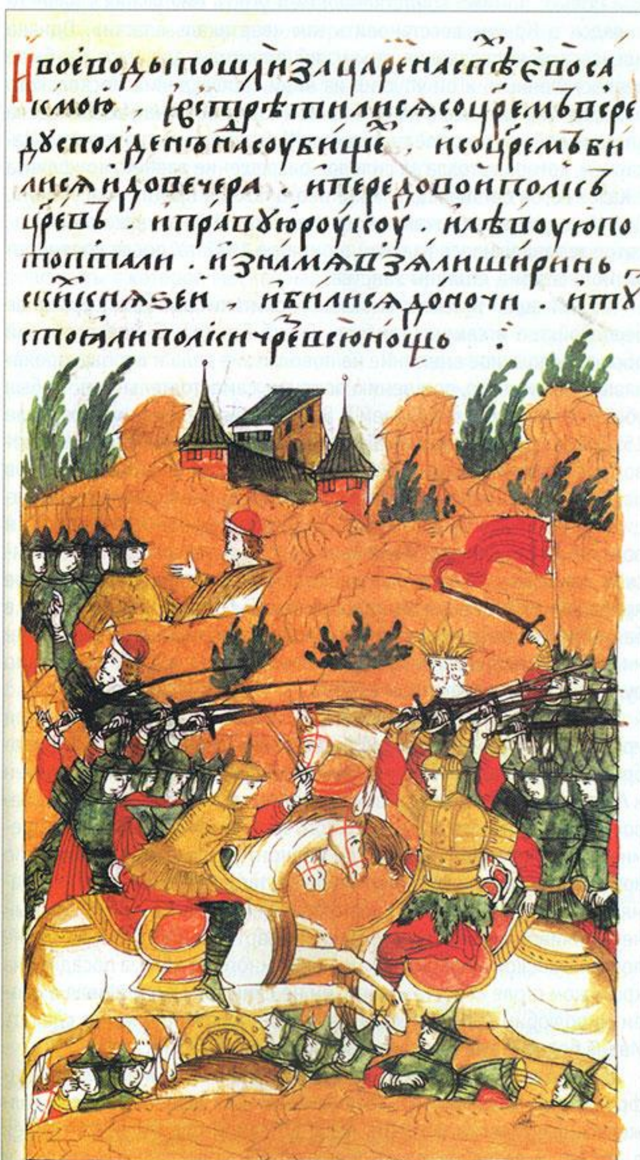
Битва на Судьбищах — первая победа России над войском Крымского ханства в полевом сражении. 1555 г. Миниатюра Лицевого летописного свода.

Забывать об этих словах было никак нельзя — в Москве прекрасно помнили, чем закончилась попытка переиграть сына Менгли-Гирея Мухаммед-Гирея I. Этот хан, недовольный двуличной политикой Василия III (как метко заметил И. В. Зайцев, «и Крым, и Москва часто вели друг с другом двойную игру, лавируя и виляя, отрицая очевидные истины и стремясь убедить противника в заведомой дезинформации» 11 ), летом 1521 года внезапно объявился на Оке под Коломной. В скоротечном сражении он разгромил русские полки и опустошил окрестности русской столицы. Отдельные татарские