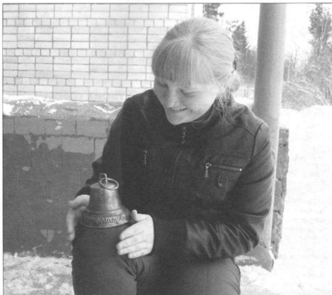
Автор работы Ксения Григорьева

тернета, выяснить историю школьного праздничного колокольчика МОУ «Першинская средняя общеобразовательная школа» и определить, представляет ли он собой художественную ценность.