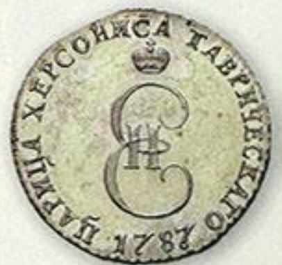
Потёмкинские монеты. 20 копеек. 1787 г.