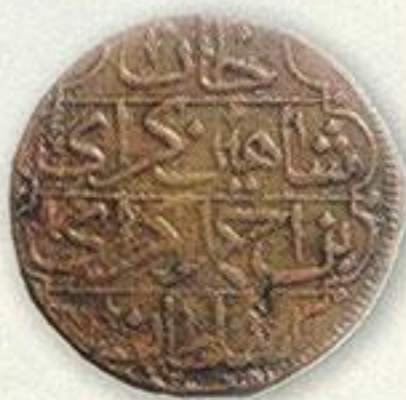
Крым. Копейка. 4-й год правления, ранний тип.