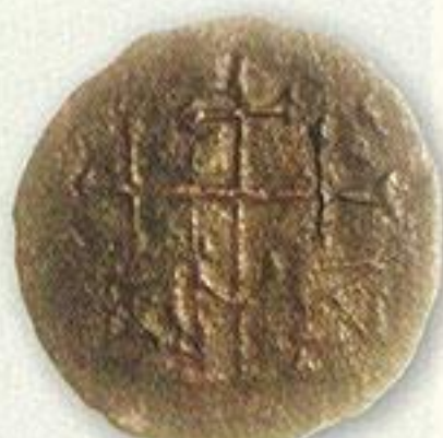
Тмутаракань. Позднее медное подражание.