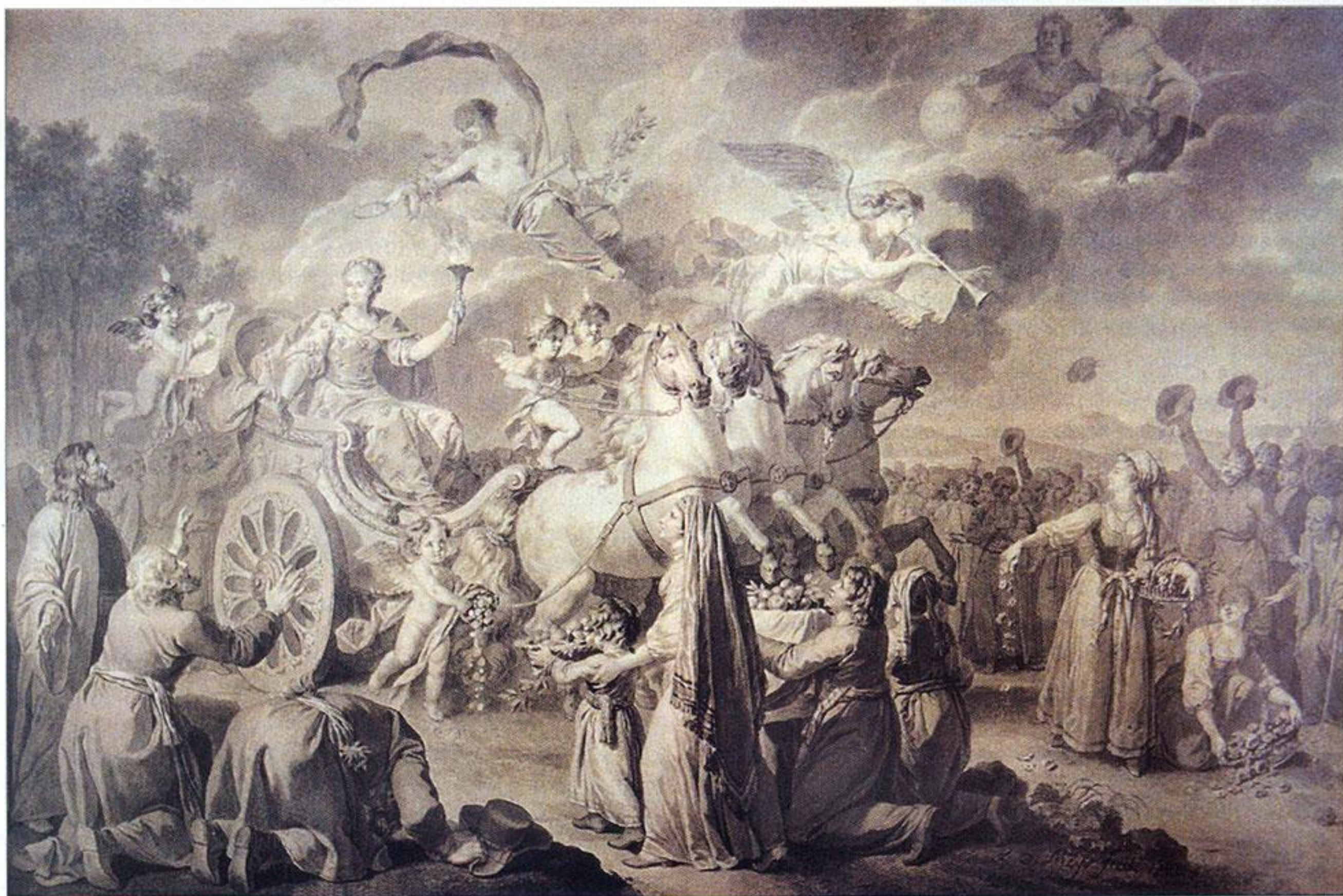
Екатерина II, путешествующая в своём государстве в 1787 году. Аллегория. Рисунок Ф. де Мейса.

Военные действия начал подвластный османам крымский хан, которым тогда Порта сделала Крым-Гирея. В 1769 году он предпринял очередной массивный набег на южнорусские земли — этот набег стал последним в истории. Разгромленные орды вынуждены были отступить в степи, чтобы зализывать раны. Больше с набегам на южнорусские земли они уже не возвращались. А