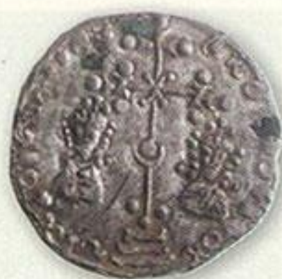
Тмутаракань. Раннее серебряное подражание.

Похоже, что чекан монет в Тмутараканском княжестве продолжался дольше, чем в стольном Киеве, и прекратился на рубеже XI–XII веков. Снова события в Крыму повлияли на