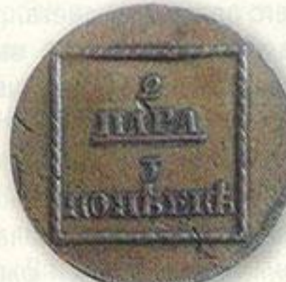
Монеты для Молдавии и Валахии. 2 пара — 3 копейки.