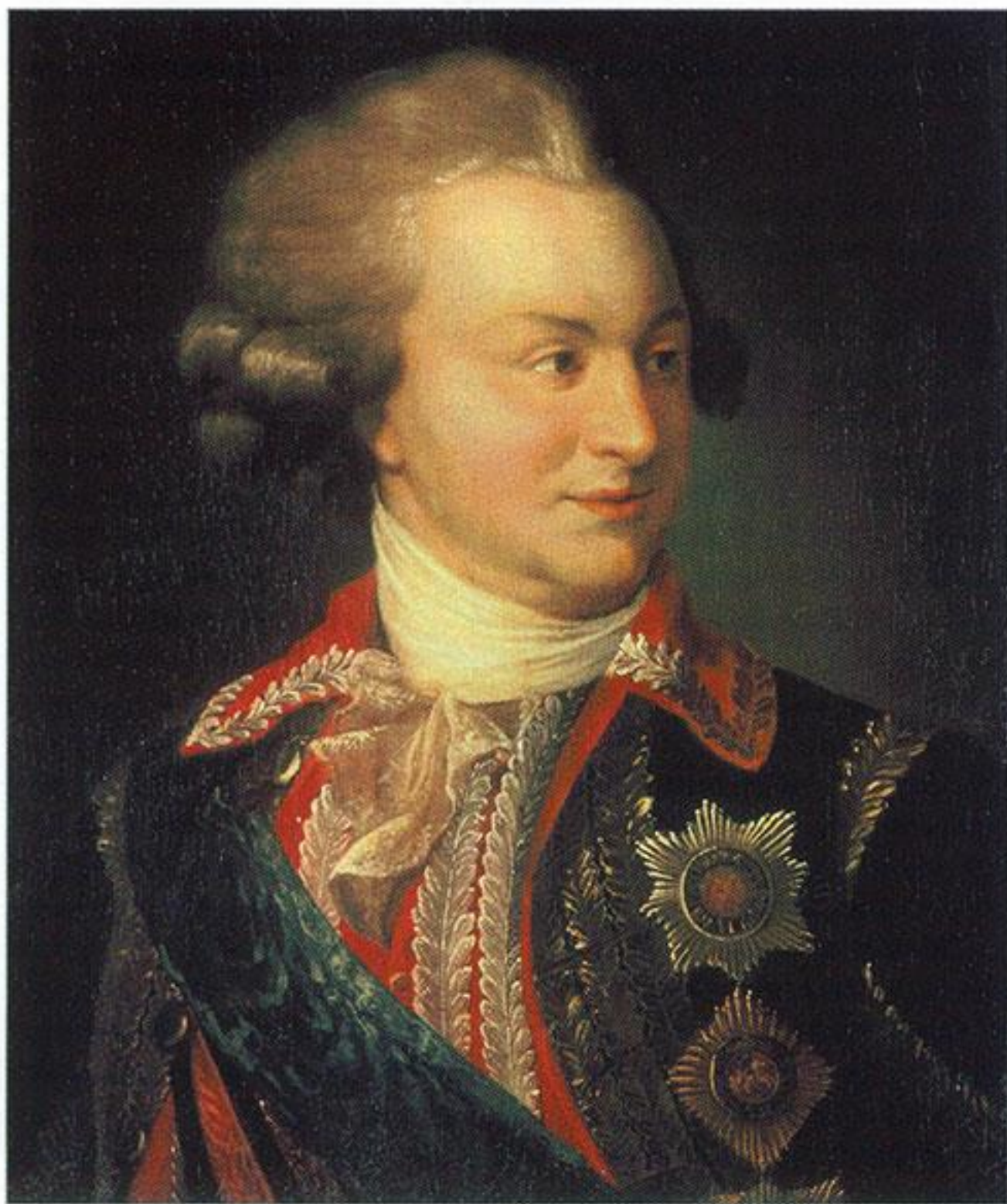
И.-Б. Лампи-старший. Портрет генерал-фельдмаршала светлейшего князя Г. А. Потёмкина-Таврического. 1791 г.

ми для российских торговых судов. Расширились права православных народов, подвластных Порте (молдаван, румын, греков, славян, армян), Крым получал независимость.