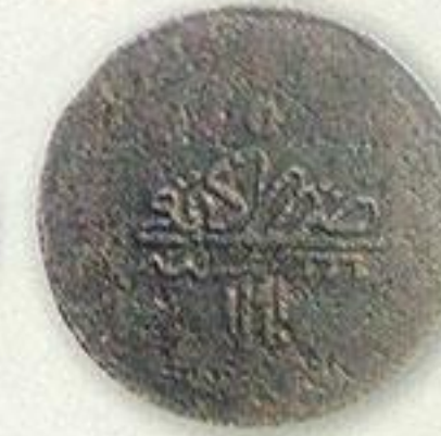
Крым. Чхаль. 5-й год правления.