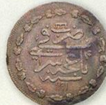
Крым. Кырмыз. 4-й год правления.