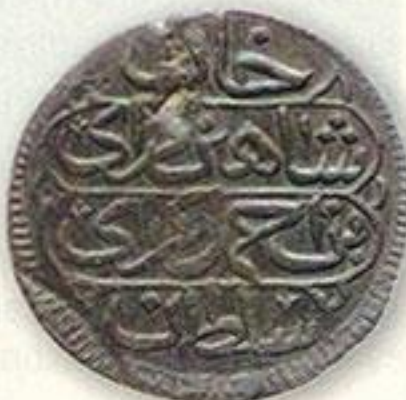
Деньга. 6-й год правления.