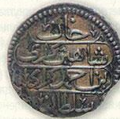
Крым. Копейка. 4-й год правления. «Перепутка» (вместо 1191 года проставлен 1911 г.).